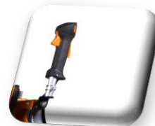
Poignée de Gaz Homme mort