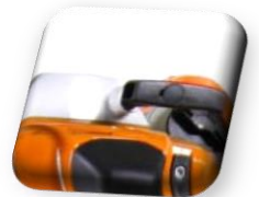
STIHL ERGOSTART Démarrage facile