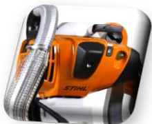
Moteur STIHL FS561 2,8 kW (3,8 Cv) 300 min-1