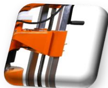
Guidage du chariot par Glisseurs téflon