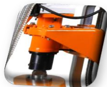
Réducteurs planétaires sans entretien